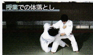
授業での体落とし