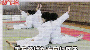
手を挙げた方向に回る