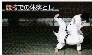
競技での体落とし