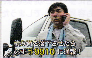
隊員が装着したカメラによる映像