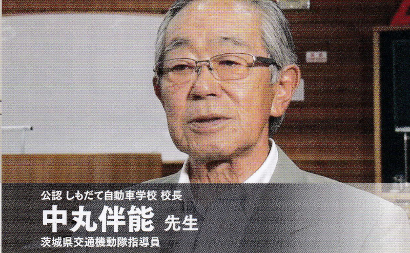
公認 しもだて自動車学校 校長