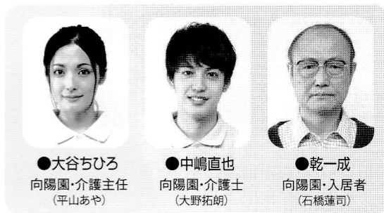
●大谷ちひろ 向陽園・介護主任 (平山あや)

翌日から直也は欠勤。直也の母が退職願を持って「向陽園」を訪れ、直也がアスペルガー症候群であることを告白する。いったん退職願を受理したものの、ちひろは直也をこのまま辞めさせていいものか悩む。そしてちひろは、直也が乾を金山川へ連れていった理由を聞くため、入院中の乾を訪ねたのであった……。