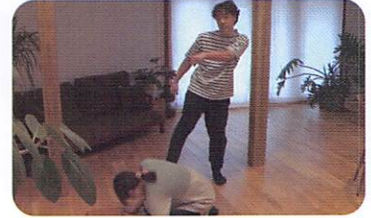
加害者のゆがんだ認知