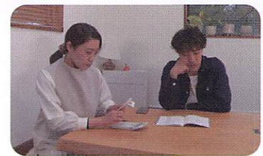
人の行動のメカニズム