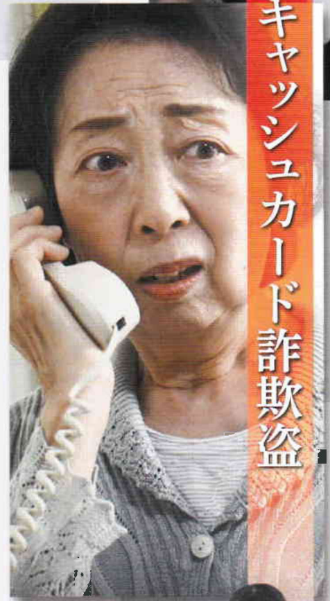
キャッシュカード詐欺盗