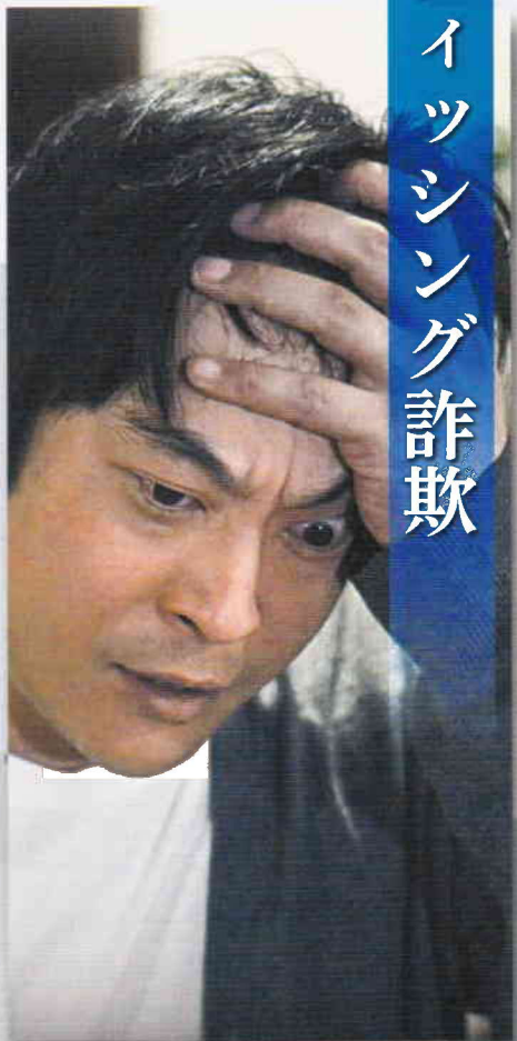
フィッシング詐欺