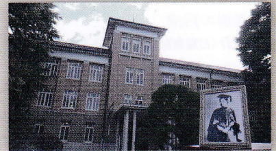
現在の津田塾大学