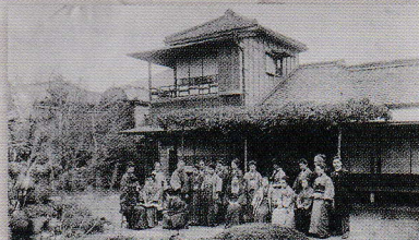
女子英学塾(のちの津田塾大学)開校 (1901年、明治33年)