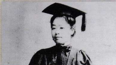
アメリカ・プリンマー大学留学当時