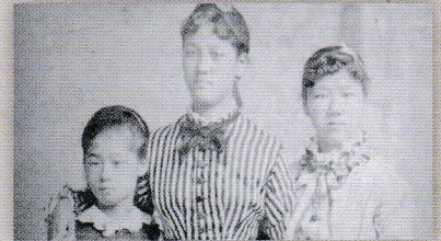
日本初の女性留学生たちと (左：津田梅子、中：山川捨松、右：永井繁子)