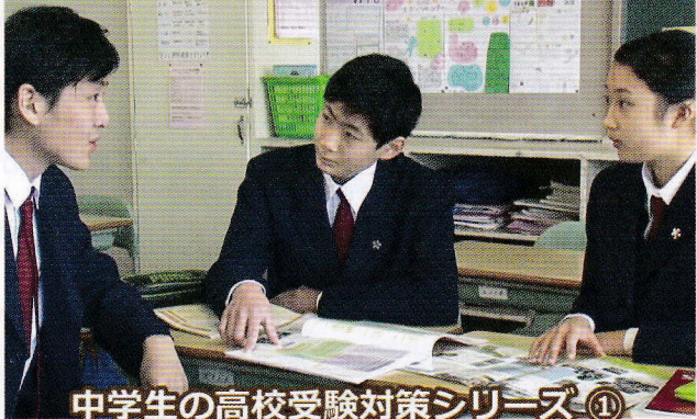
中学生の高校受験対策シリーズ ①