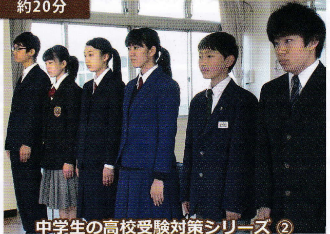
中学生の高校受験対策シリーズ ②