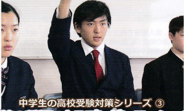
中学生の高校受験対策シリーズ ③