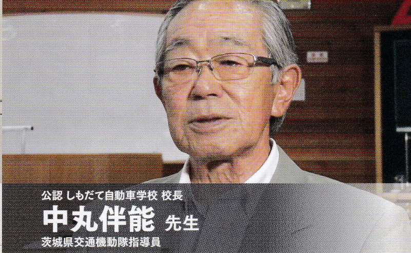
公認 しもだて自動車学校 校長