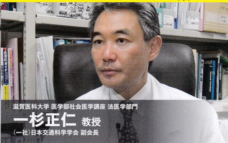
滋賀医科大学 医学部社会医学講座 法医学部門

医学博士・日本リハビリテーション医学会専門医 日本脳神経外科学会認定医・首都大学東京客員教授