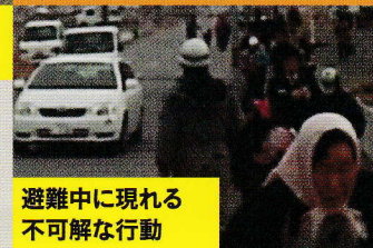
避難中に現れる 不可解な行動

ご覧になりたい項目を選んで再生することが可能です(メニュー画面内容①地震②津波③火災④緊急時の心理と行動)