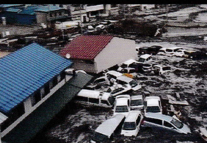
津波の恐ろしさ・宮古市役所提供映像 (渋滞で動けない車を津波が...)