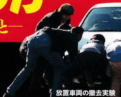
放置車両の撤去実験

いつ起きてもおかしくない次の巨大地震!そして津波!火災! その時ドライバーはどう危険を回避すればいいか。 生き残るための知恵と行動とは何か? 東日本大震災・被災地の ドライバーの体験、そして専門家の分析と意見に学ぶ。