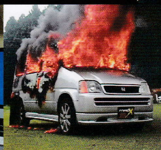
車両火災実験で明らかになった 事実とは?