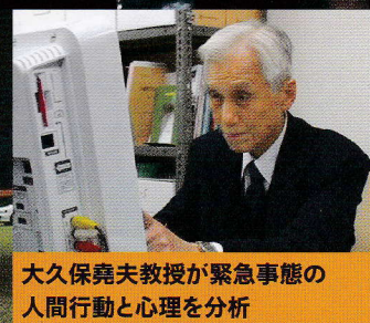
大久保堯夫教授が緊急事態の 人間行動と心理を分析